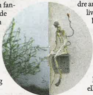
Rolf Nowotny, DOLDRUM, 2018-21 (detalje).

Guld og magi 22. april - 8. august Udstillingen 'Guld og magi' udforsker menneskets historiske og samtidige forhold til guld gennem en udstilling af værker, der rejser gennem årtusinder for at undersøge guldets magt og magi. Guld har altid fascineret mennesket.